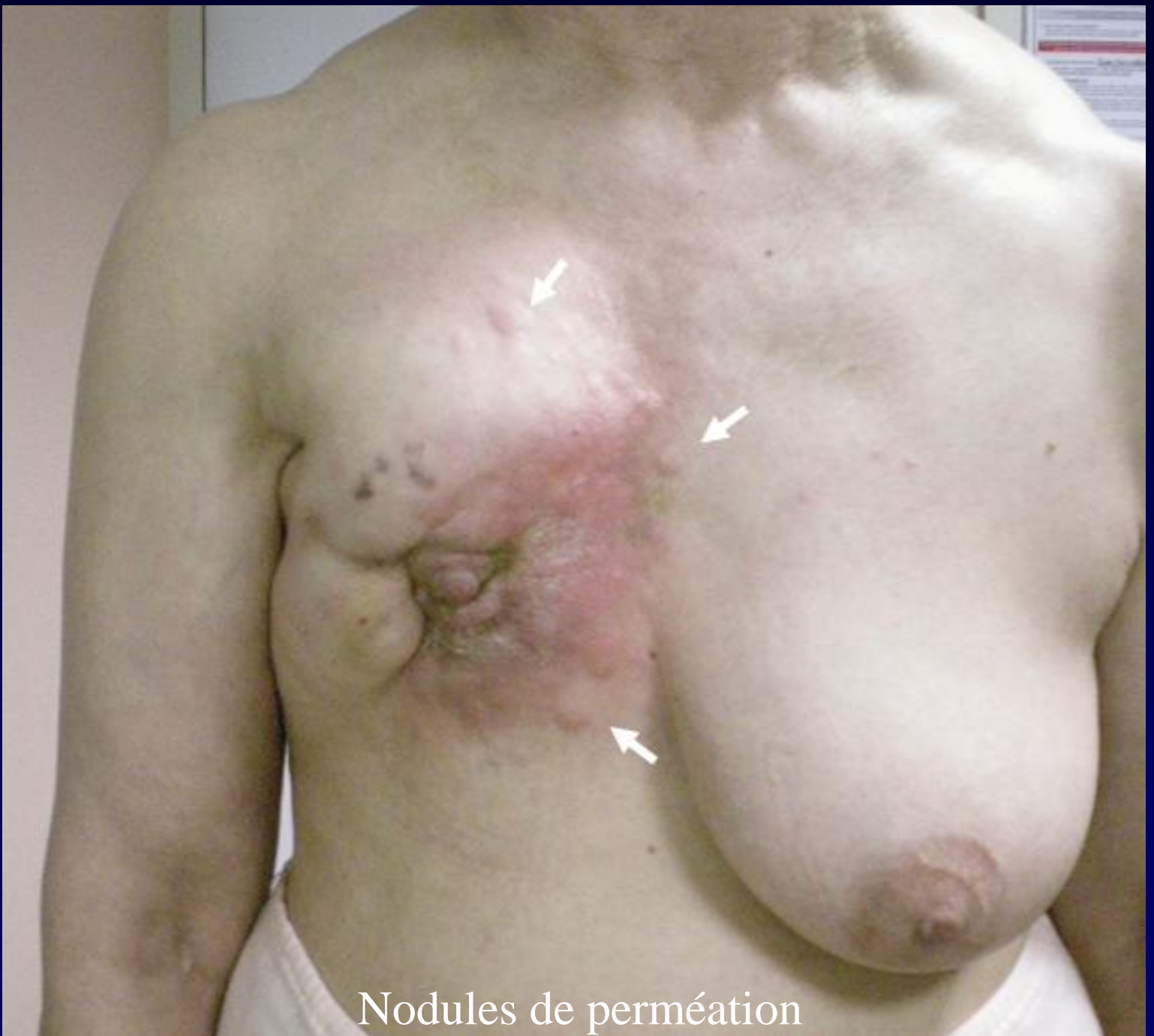
Nodules de perméation