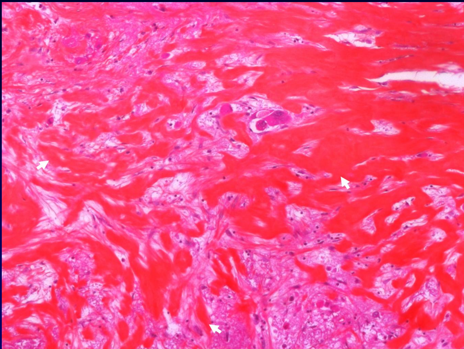
HES ; fibrose extensive (flèches)